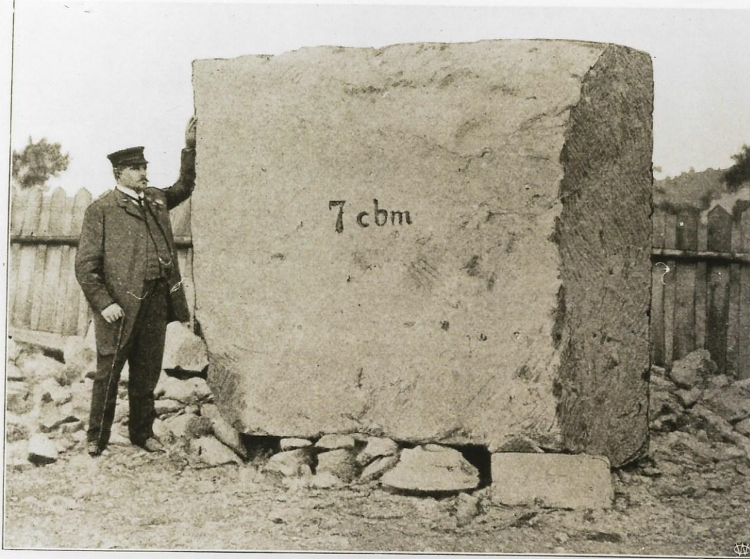
Trachyttuff-Bruchstück von sieben cbm für den Postneubau in Augsburg.