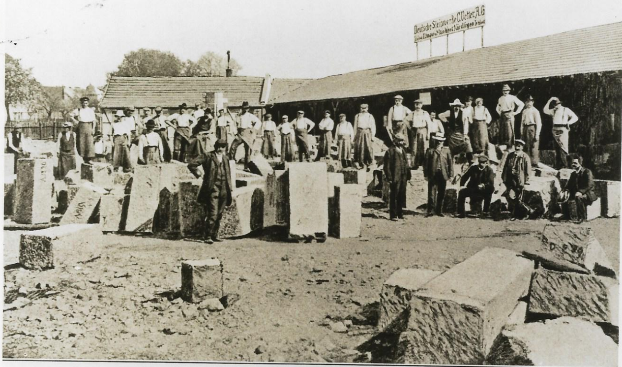
Werkplatz in Nördlingen der „Deutschen Steinwerke C. Vetter A. G., Eltmann a. Main.“